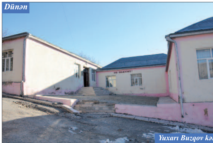
Yuxarı Buzqov kənd orta məktəbi