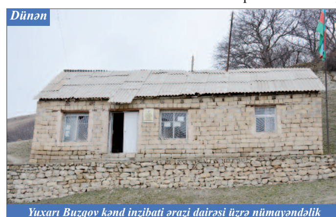
Yuxarı Buzqov kənd inzibati ərazi dairəsi üzrə nümayəndəlik

Bu an insan əsl qış ab-havasına köklənir. Ətrafa göz gəzdirirəm. Artıq hər bir naçıvanlı ailəsi üçün