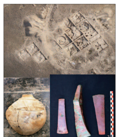
Ovçular təpəsi yaşayış yerinin arxeoloji tədqiqi zamanı aşkar olunan tapıntılar

nekropolları kimi qəbir abidələri tədqiq edilmişdir. Erkən Tunc dövrü abidələrindən aşkar olunan arxeoloji mədəniyyət “Kür-Araz mədəniyyəti” adlandırılıb. Naxçıvanın Kür-Araz mədəniyyəti abidələrinin tədqiqi bu mədəniyyətin mənsəyi, xronologiyası və inkişaf xüsusiyyətləri ilə bağlı bir sıra məsələlərə aydınlıq gətirir. Qafqaz, o cümlədən Azərbaycan ar-