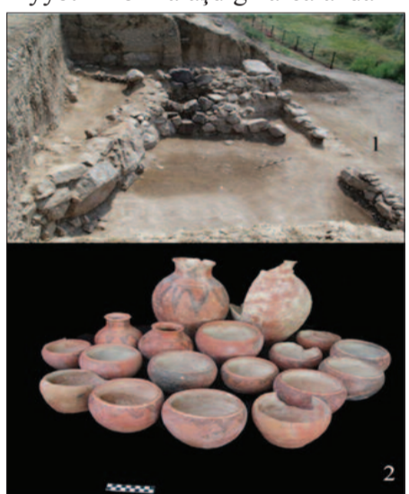
Qızqala yaşayış yeri və nekropolunun tədqiqi zamanı aşkar olunan tapıntılar

2017-ci ildə Naxçıvan şəhəri ərazisində yerləşən Naxçıvantərəpə yaşayış yerinin tədqiqi zamanı Naxçıvantərəpədə Dalmatəpətiplə keramika məmulatının aşkar olunması bu mədəniyyətin yayılma arealının Naxçıvanı da əhatə etdiyini təsdiq edib. Daha doğrusu, Naxçıvan bu mədəniyyətin formalaşdığı areala daxil