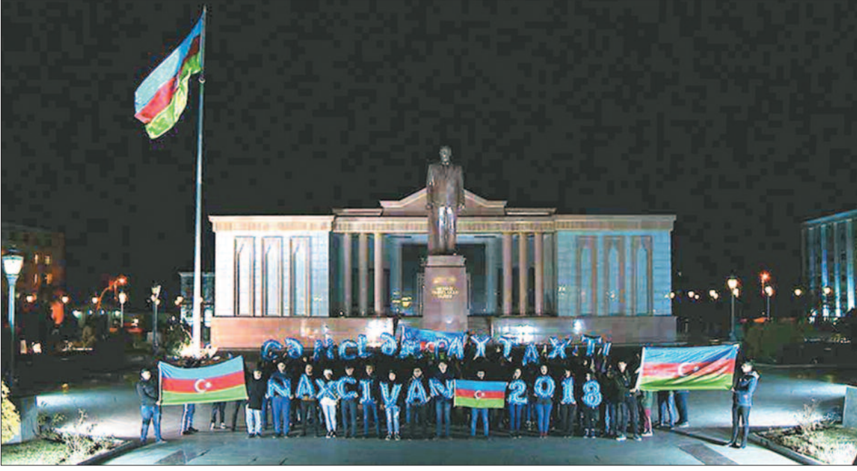
"Gənclər Paytaxtı"nın gəncləri