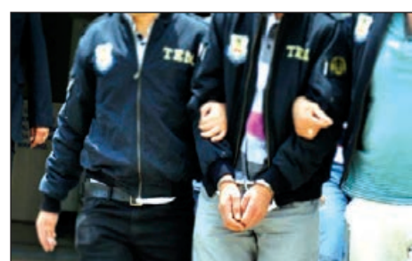
Daxili İşlər Nazirliyinin digər məlumatı bildirilir ki, başına 300 min türk