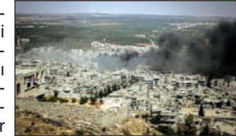
Suriya müxalifətindəki mənbələrin verdiyi məlumatla görə, Marratinnaman rayonu, hə-

Rusiya Hərbi Kosmik Qüvvələri və Bəşşar Əsəd rejimi aviasiyasının İdlibdəki deeskasiya zonasının bombardmanı zamanı həlak olmuş dinc sakinlərin sayı 15-ə çatmışdır. Bu barədə "Anadolu" agentliyi xəbər verir.