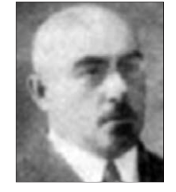
Kimdir Xatısyan? Xatısyov (Xatısyan) Alek-