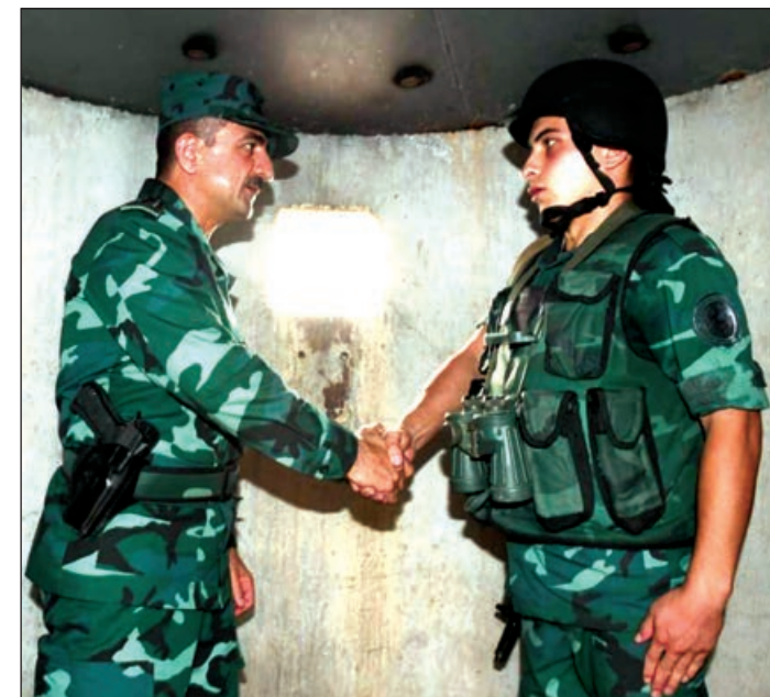
Dövlət Sərhəd Xidmətinin rəhbər vəzifəli şəxslərinin iştirakı ilə keçirilmiş xidməti-müşavirədə hərbi hissə və bölmələrin döyüş hazırlığının yüksəldilməsi, dövlət sərhədinin toxunulmazlığının və şəxsi heyətin təhlükəsizliyinin təmin edilməsi istiqamətində zəruri tapşırıqlar verilib.