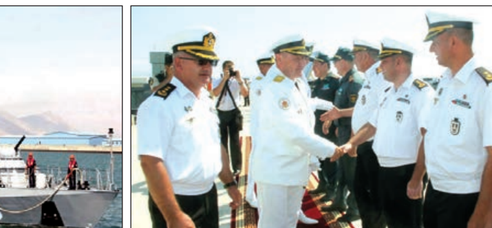
Müdafiə Nazirliyinin mətbuat xidmətindən AZƏRTAC-a bildiribler ki, görüşlərdə Azərbaycanın Xəzər dənizindəki ərazi sularında "Beynəlxalq Ordu Oyunları-2019" yarışları çərçivəsində keçiriləcək "Deniz Kuboku" müsabiqəsinin təşkilində dair fikir mübadiləsi aparılıb.