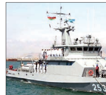
Müdafiə Nazirliyinin mətbuat xidmətindən AZƏRTAC-a bildiribler ki, görüşlərdə Azərbaycanın Xəzər dənizindəki ərazi sularında "Beynəlxalq Ordu Oyunları-2019" yarışları çərçivəsində keçiriləcək "Deniz Kuboku" müsabiqəsinin təşkilində dair fikir mübadiləsi aparılıb.

Azərbaycan Hərbi Dəniz Qüvvələrinin komandanı vəzifəsini icra edən 1-ci dərəcəli kapitan Zaur Hüməmatov iyulun 30-da Qazaxıstan Hərbi Dəniz Donanmasının nümayəndəsi, 1-ci dərəcəli kapitan Kanat Niyazbekovun və İran İslam Respublikasının Hərbi Dəniz Qüvvələrinin nümayəndəsi, 1-ci dərəcəli kapitan Hüseyn Həsənovun rəhbərlik etdikləri nümayəndə heyətləri ilə görüşlər keçirib.