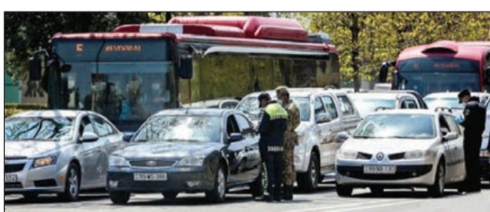
tətbiq edilən xüsusi karantin rejiminin pozulmasına görə aprelin 17-si saat 00:00-dan aprelin 18-i saat 00:00-dək olan müddət ərzində respublikanın avto-

Daxili İşlər Nazirliyinin Baş Dövlət Yol Polisi İda-rəsi ölkə ərazisində tətbiq edilmiş xüsusi karantin re-jimi ilə əlaqədar aprelin 17-si saat 00:00-dan aprelin 18-i saat 00:00-dək olan müddət ərzində DYP əməkdaşları tərəfindən gö-rülmüş işlər barədə məlu-mat yayıb. İdarədən AZƏ-RTAC-a bildirlər ki, korona-virus (COVID-19) infeksi-yasının yayılmasının qarşı-sının alınması məqsədilə