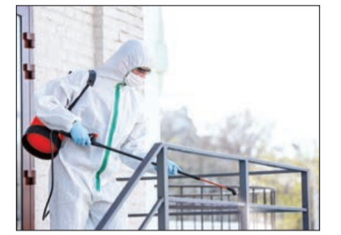
dılması pandemiya ilə əlaqədar ölkədə əhalinin məşğulluq imkanlarının artırılması xidməti edir və proses gündəlik olaraq davam edəcək.

Yeni yaradılan ictimai iş yerləri əsasən dezinfeksiya işlərinin aparılması, həssas qruplara sosial xidmətlərin göstərilməsi və s. kimi sahələri əhatə edir. Yeni ödənişli ictimai iş yerlərinin yara-