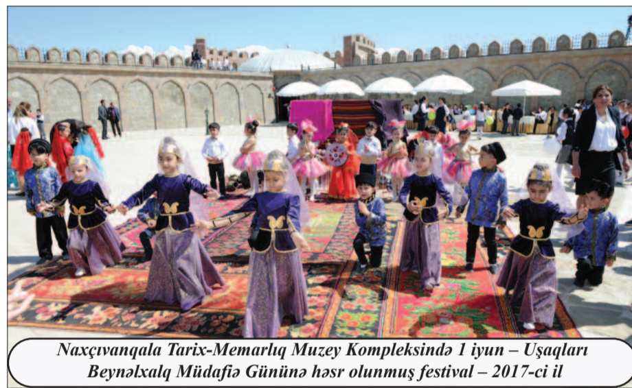
Naxçıvanqala Tarix-Memarlıq Muzey Kompleksində 1 iyun – Uşaqları Beynəlxalq Müdafiə Gününa həsr olunmuş festival – 2017-ci il

Uşaqların sağlamlıqlarının qorunması ilə bağlı həyata keçirilən tədbirlərin nəticəsi olaraq uşaq tibb müəssisələrinin maddi-texniki bazasının yaxşılaşdırılması, müasir avadanlıqlarla təchiz edilməsi, yeni texnologiyaların tətbiqi, tibbi kadrların peşə səviyyəsinin artırılması və əhali arasında geniş maarifləndirmə işinin aparılması istiqamətlərində mühüm addımlar atılmışdır. Naxçıvan Muxtar Respublikası Ali Məclisi Sədrinin 2018-ci il 9 oktyabr tarixli Sərəncamı ilə təsdiq olunmuş “Naxçıvan Muxtar Respublikasında uşaqların icbari dispanserizasiyadan keçirilməsinə dair 2018-2022-ci illər üçün Dövlət Proqramı”nın qəbul olunması bu sahədə atılan mühüm addımlardan biridir. Həyata