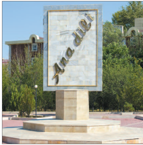
1 avqust Azərbaycan Əlifbası və Azərbaycan Dili Günüdür

Dilimizin saflığı və yaşaması uğrunda mübarizə XIX əsrin əvvəllərindən XX əsrin ortalarına qədər davam etsə də, onun dövlət dili səviyyəsinə qaldırılması, qorunması və inkişafı ümummilli liderimiz Heydər Əliyevin adı ilə bağlıdır. Ulu öndər hakimiyyətdə olduğu bütün dövrlərdə Azərbaycan dilini milli varlığın əsası kimi həmişə diqqət mərkəzində saxlamış, 1978-ci ildə Azərbaycan dilinin Azərbaycan SSR Konstitusiyasında dövlət dili kimi xüsusi maddədə göstərilməsinə nail olmuşdu. Həmin dövrdə Azərbaycan dilinin qrammatik quruluşunun elmi şəkildə öyrənilməsinə başlanılmış, dilçi alimlərin fəaliyyəti üçün geniş imkanlar açılmış, elmi-tədqiqat materialları və kitablar nəşr olunmuşdur. Azərbaycan dilinə və ümu-