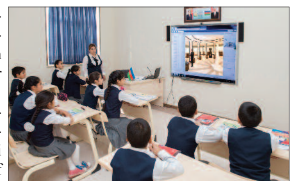
Naxçıvan şəhəri, Tumbul kənd tam orta məktəbi