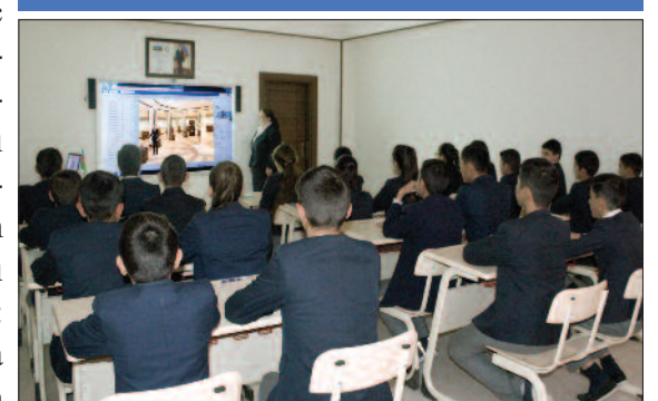
Ordubad şəhər 3 nömrəli tam orta məktəbi

dövrə insanların məişətdə istifadə etdiyi daş əmək alətləri, son dövrlərdə duzdan hazırlanmış əl işləri barədə geniş məlumat verilib.