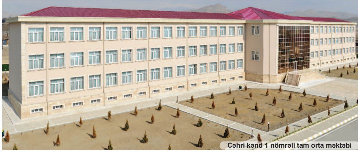
Cəhri kənd 1 nömrəli tam orta məktəbi

Direktorla söhbətdən: – Son illər kənd yaşayış məntəqələrində yeni niyyətə və gənclərin musiqi təhsili alması üçün məqsədyönlü tədbirlər həyata keçirilir. Yerlərdə musiqi məktəbləri üçün binaların tikilib istifadəyə verilməsi məhz bu məqsədə xidmət edir. Cəhri Kənd Uşaq Musiqi Məktəbi muxtar respublikamızda yaxşı uğurları olan məktəblərdən biridir. Kollektivimiz üçün yeni binanın inşa olunması məs-