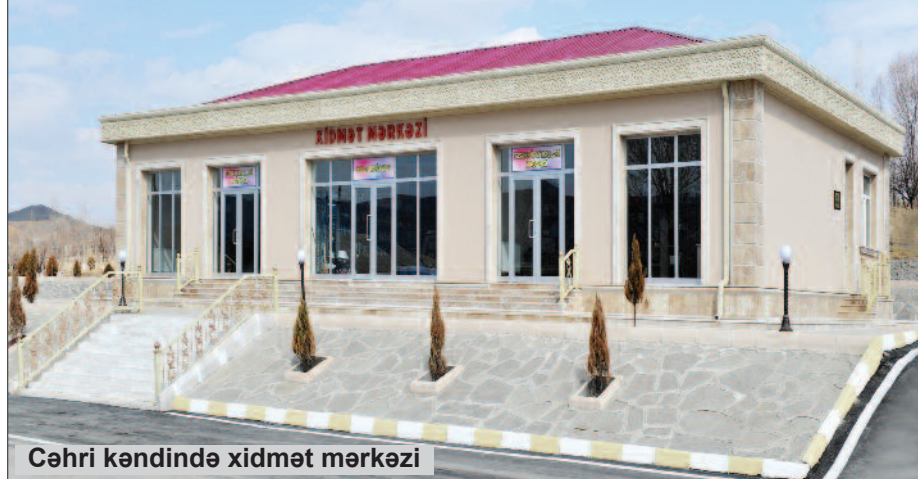
Cəhri kəndində xidmət mərkəzi

– Bu kənddə doğulmuşam. Burada boya-başa çatmışam. Dediğim odur ki, Cəhri kəndini dünənini yaxşı