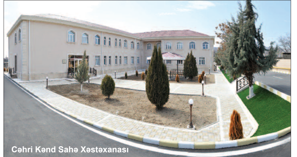
Cəhri Kənd Sahə Xəstəxanası