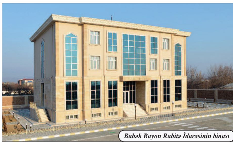
Babək Rayon Rabitə İdarəsinin binası

əlaqədar "Elektron hökumət" portalı üzərindən rabitə və internet xidmətləri, elektrik enerjisi, qaz və sudan istifadə haqlarının onlayn rejimdə ödənilməsi təşkil edilmiş, istifadəçilərin portaldan qeydiyyatdan keçməsi avtomatlaşdırılmış və portalın təhlükəsizliyi ilə əlaqədar tədbirlər görülmüşdür. "Bir pəncərə" prinsipi əsasında dövlət orqanlarının xidmətləri portala inteqrasiya edilmişdir. Naxçıvan Muxtar Respublikasının Rabitə və Yeni Texnologiyalar Nazirliyi tərəfindən 80-dən artıq dövlət təşkilatına və 12 idman federasiyasına