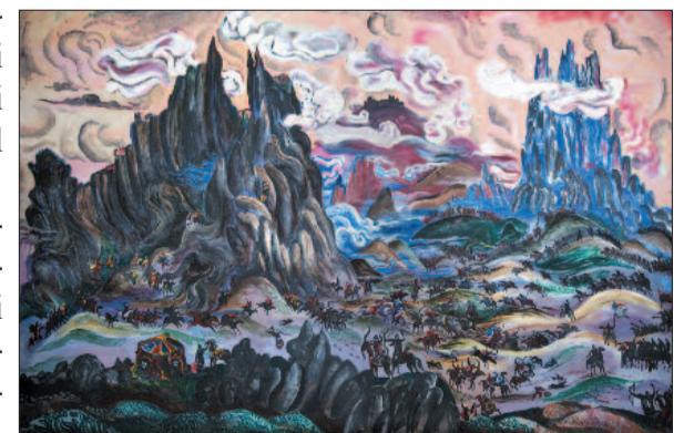
Toğrul Nərimanbəyov "Əlinçəqalanın müdafiəsi"

divarları da bişmiş kərpiclə bərpa olunub. Eyni vaxtda aparılan bərpa işləri zamanı ərazidə iki otaq və ekspozisiya zalından ibarət "Əlinçəqala" Muzeyi də yaradılıb. Ekspozisiya zalında ümummilli lider Heydər Əliyevin "Əlinçəqala və bir çox belə abidələr Naxçıvanın qədim Azərbaycan torpağı olduğunu, azərbaycanlıların burada əsrlərlə, min illərlə yaşayıb yaratdığını göstərir" fikri, Əlinçəqalada məskunlaşan insanların həyat tərzini əks etdirən maddi-mədəniyyət nümunələri, xüsusilə qədim məişət əşyaları, qalada aparılan arxeoloji qazıntıların zamanı tapılan maddi nümunələr, Naxçıvanın və Əlinçəqalanın tarixi ilə bağlı nəşrlər, bərpadan əvvəl, bərpa zamanı və bərpadan sonrakı fotosəkilləri nümayiş etdirilir.