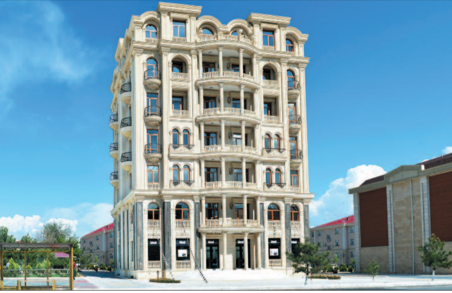
Azərbaycan Respublikasının Prezidenti cənab İlham Əliyevin 2009-cu il 16 dekabr tarixli Sərəncamına əsasən hər il aprelin 10-u ölkəmizdə "İnşaatçılar Günü" kimi qeyd olunur.

İnşaat sektorunun inkişafı, bütövlükdə, ölkənin sosial-iqtisadi tərəqqisinə təkan verən mühüm amillərdən biri hesab edilir. Məhz buna görədir ki, ümummilli liderimiz Heydər Əliyev ölkəmizə rəhbərlik etdiyi illərdə tikinti-quruculuq işlərinə xüsusi diqqət göstərmişdir. Ötən əsrin 70-ci illərində respublikamızda tikinti sektorunun inkişafı xeyli sürətlənmiş, şəhər və rayonlarda nəhəng istehsal müəssisələri, yüzlərlə yaşayış binası, səhiyyə, mədəniyyət, təhsil obyektləri tikilib istifadəyə verilmişdi. Ümummilli liderin müstəqil Azərbaycana rəhbərliyi dövründə isə tikinti-quruculuq işlərinin həcmi daha da genişlənmiş, inşaat sektorunda fəaliyyət göstərən dövlət təşkilatlarına və özəl şirkətlərə maliyyə dəstəyi artırılmış, uzun illər bu sahədə çalışmış, peşəkarlıq qazanmış inşaatçılar öz ətrafında birləşdirən tikinti təşkilatları müntəzəkli qurucu qüvvəyə çevrilmişdir. Dahi şəxsiyyətin zəngin dövlətçilik təcrübəsi sayəsində ölkəmizdə milli memarlıq üslubu saxlanılmaqla genişmiqyaslı quruculuq proqramı həyata keçirilmişdir.