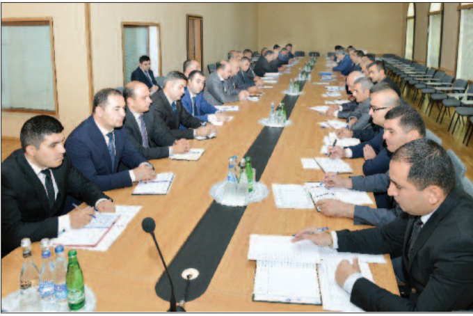
Sentyabrın 11-də Naxçıvan Biznes Mərkəzinə Naxçıvan Muxtar Respublikası İqtisadiyyat və Sənaye Nazirliyi kollektivinin və sahibkarların iştirakı ilə payız-qış mövsümünə hazırlıq və qarşıda duran vəzifələrlə bağlı tədbir keçirilib.

Tədbirdə Naxçıvan Muxtar Respublikasının iqtisadiyyat və sənaye naziri Famil Seyidov məruzə ilə çıxış edərək bildirdi ki, əhalinin payız-qış mövsümündə meyvə və tərəvəz məhsullarına olan tələbatının ödənilməsində soyuducu anbarlar mühüm əhəmiyyət kəsb edir. Məhz bu faktor nəzərə alınaraq ötən müddət ərzində dövlət dəstəyi ilə 19 hüquqi və fiziki şəxs tərəfindən ümumi tutumu 12.610 ton olan 21 soyuducu anbar istifadəyə verilib və yeni soyuducu anbarların yaradılması istiqamətində sahibkarlar arasında maarifləndirmə işləri davam etdirilir. 2015-ci ildə meyvə-tərəvəz məhsullarının saxlanması üçün tutumu 350 ton olan bir anbar istifadəyə verilib.