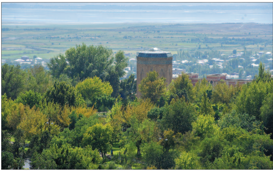
Azərbaycanın davamlı və sürətli tərəqqisinin canlı nümunəsi olan Naxçıvan bu gün regionun ən gözəl şəhərlərindən birinə çevrilib. Ölkəmizin bir parçası olan doğma diyarımız gözəlrimiz önündə tikilir, abadlaşır, yaşıllaşır.

Əhalinin sağlamlığının qorunmasında yaşıllıqların əhəmiyyəti misilsizdir. Bunu hər birimiz yaxşı bilir. Yaşillıq iqlimi, havanı mülayimləşdirir, quraqlıq və quru küləklərin qarşısını alır, atmosferin kimyəvi çirkləndiricilərinin bir hissəsini udur və dəyişdirir, həmçinin təbii fon şüalanması və səs-küyün azaldılması kimi funksiyaları yerinə yetirir. Bu nəzərə alınaraq muxtar diyarımızda yaşıllığın artırılmasına xüsusi diqqət yetirilir. Nəticə göz önündədir. Gündən-günə gözəlləşən Naxçıvan şəhərində geniş vüsət alan abadlıq və quruculuq işləri ilə yanaşı, yeni yaşıllıq sahələrinin salınması da diqqət mərkəzindədir. Çünki təbiəti qorumaq, təbii sərvətlərdən səmərəli istifadə etmək, yaşıllıqların mühafizəsinə nəzarəti gücləndirmək sağlamlığımızın təminatıdır.