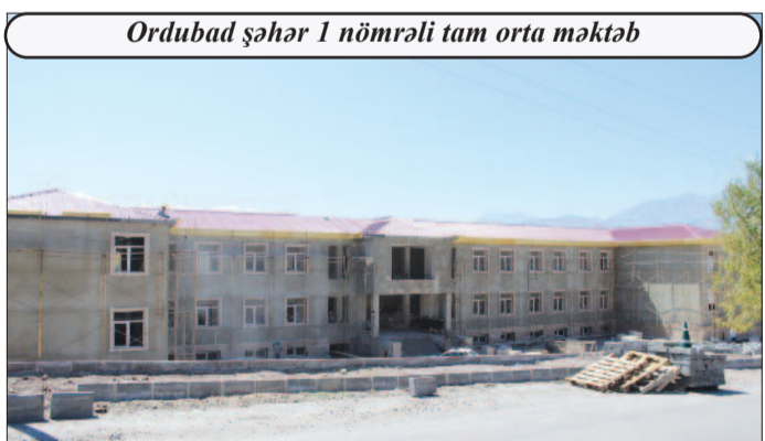
Ordubad şəhər 1 nömrəli tam orta məktəb

Geniş imkanların yaradılacağı 2 mərtəbədən ibarət Şəhriyar kənd tam orta məktəbi 226 şagird yerlik olacaq. Müasir görkəmi ilə göz oxşayacaq təhsil ocağında interneta çıxışı olan kompüter və elektron lövhə quraşdırılacaq, kitabxana fondu da zənginləşdiriləcək. Binanın həyatında abadlıq işləri aparılacaq, müasir işıqlandırma sistemləri quraşdırılacaq.