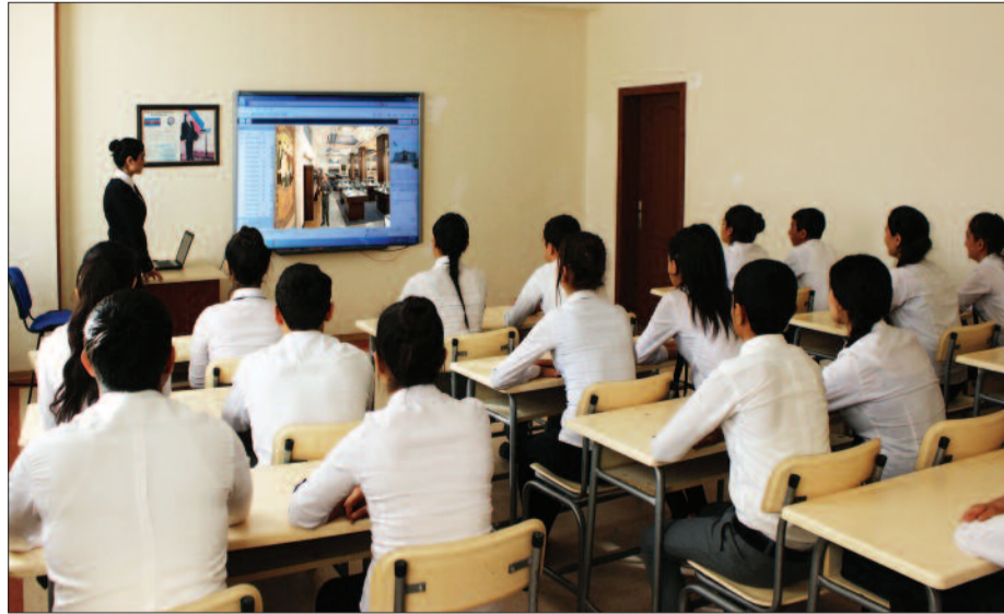
Şərur rayon Aşağı Yaycı kənd tam orta məktəbi

edib. Bildirilib ki, dahi şəxsiyyət Heydər Əliyev doğma xalqını düşdüyü bələlərdən xilas etmək üçün 1990-cı ilin iyulunda Azərbaycana qayıdıb, əvvəlcə Bakıya, sonra isə Naxçıvana gəlib. Həmin ildə də Azərbaycan Ali Sovetinə və Naxçıvan MSSR Ali Sovetinə deputat