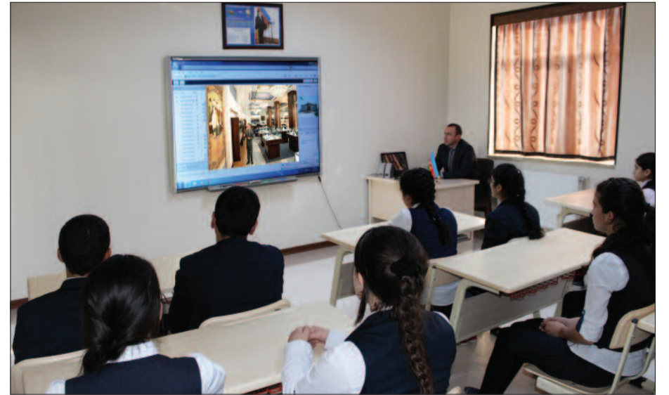
Şahbuz rayon Kükü kənd tam orta məktəbi

Vurgulanıb ki, Azərbaycanın 40 ildən artıq bir dövrünü əhatə edən tarixi taleyi ulu öndər Heydər Əliyevin adı ilə bağlıdır. Ümummilli liderimiz ölkəyə rəhbərlik etdiyi illər ərzində daim tərəqqisi üçün çalışdığı, zəngin mədəniyyəti, böyük tarixi keçmişini ilə həmişə qürur duyduğu Azərbaycanı bir dövlət kimi zamanın ağır və sərt sınaqla-