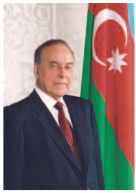
Doğma, canım-varlığım qədr sevdiyim Azərbaycanın mənim qibləgahımdır