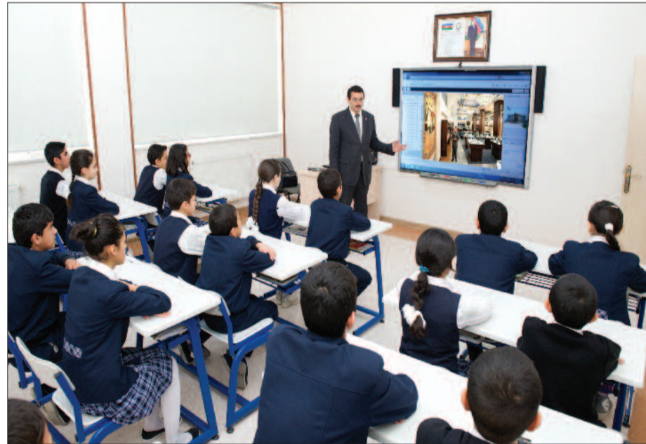
Naxçıvan şəhərindəki Heydər Əliyev adına tam orta məktəb