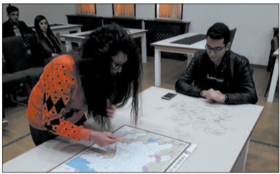
Ağbulaq İstirahət Mərkəzində muxtarmahnıyazımızın fəal gənc-