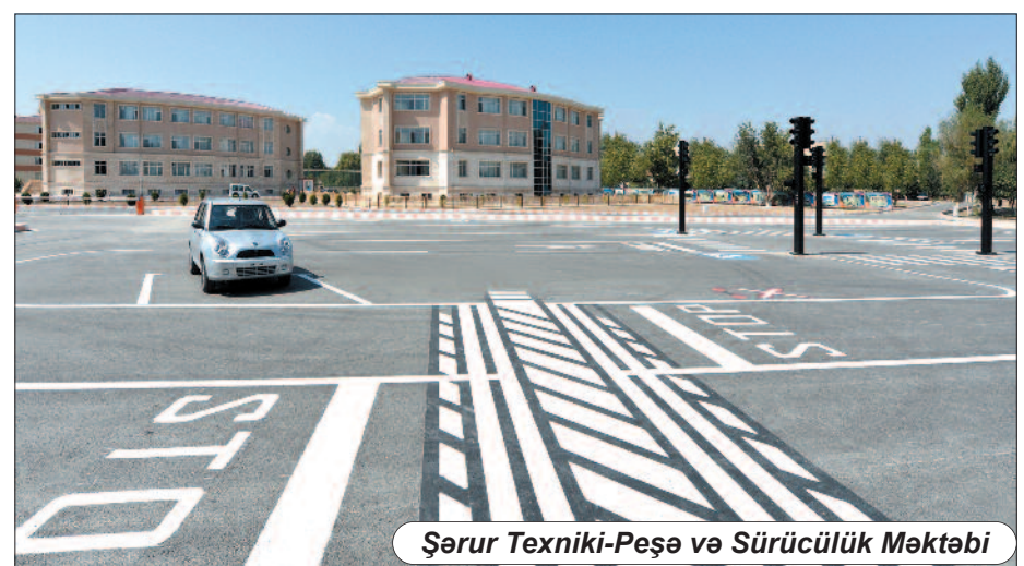
Şəur Texniki-Peşə və Sürücülük Məktəbi

Sürətlə inkişaf edən qabaqcıl texnologiyalardan istifadə edə bilən, savadlı, səriştəli kadrlara, həmçinin bazar iqtisadiyyatı ilə əlaqədar sahibkarlıq, menecment, ofisiyant, turizm bələdçisi, kompüter operatoru və digər ixtisaslara olan ehtiyacları ödəyəcək texniki peşə təhsili şəbəkəsinin genişləndirilməsi və onun maddi-texniki bazasının möh-