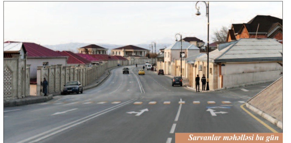
Sarvanlar məhəlləsi bu gün