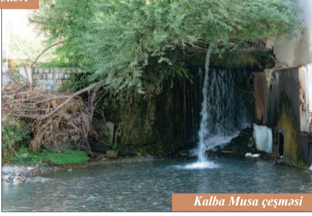
Kalba Musa çeşməsi