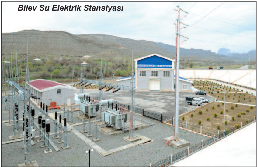
Bilov Su Elektrik Stansiyası

20 oktyabr energetika işçilərinin peşə bayramıdır