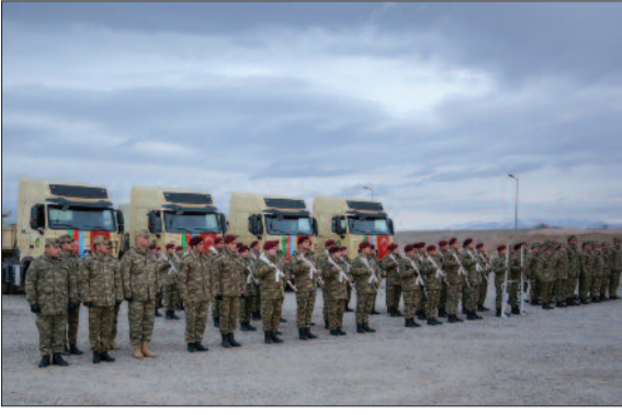
Qardaş Türkiyə Respublikasının Qars şəhərində keçiriləcək "Qış təlimi-2021"də Əla-