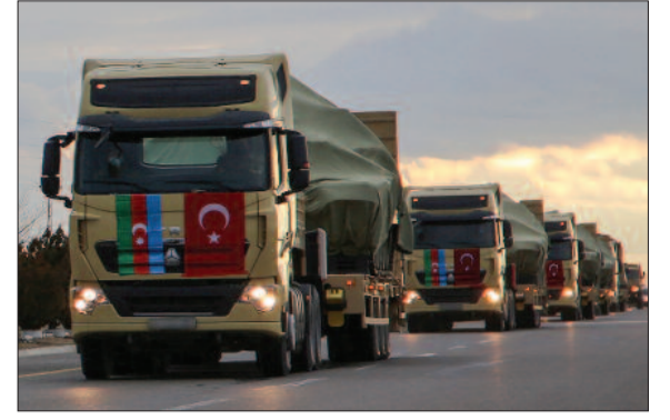
hərəkəti davam etdiriblər.

Çıxışlardan sonra təlimə cəlb edilmiş bölmələr Naxçıvan şəhərindən Sədərək sərhədkeçid məntəqəsinə doğru yola düşüblər. Araz çayı üzərindəki "Ümid" körpüsündən keçən bölmələrimiz Qars şəhəri istiqamətində