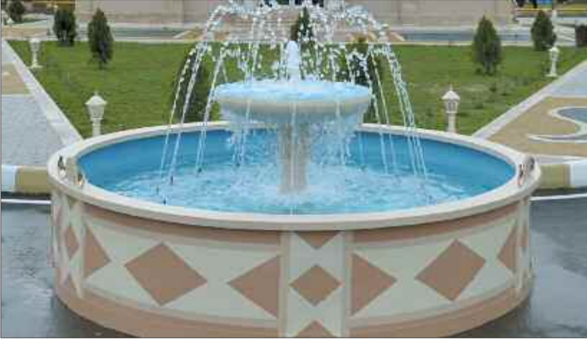
Naxçıvan şəhərinin Tumbul kəndində içməli su şəbəkəsi