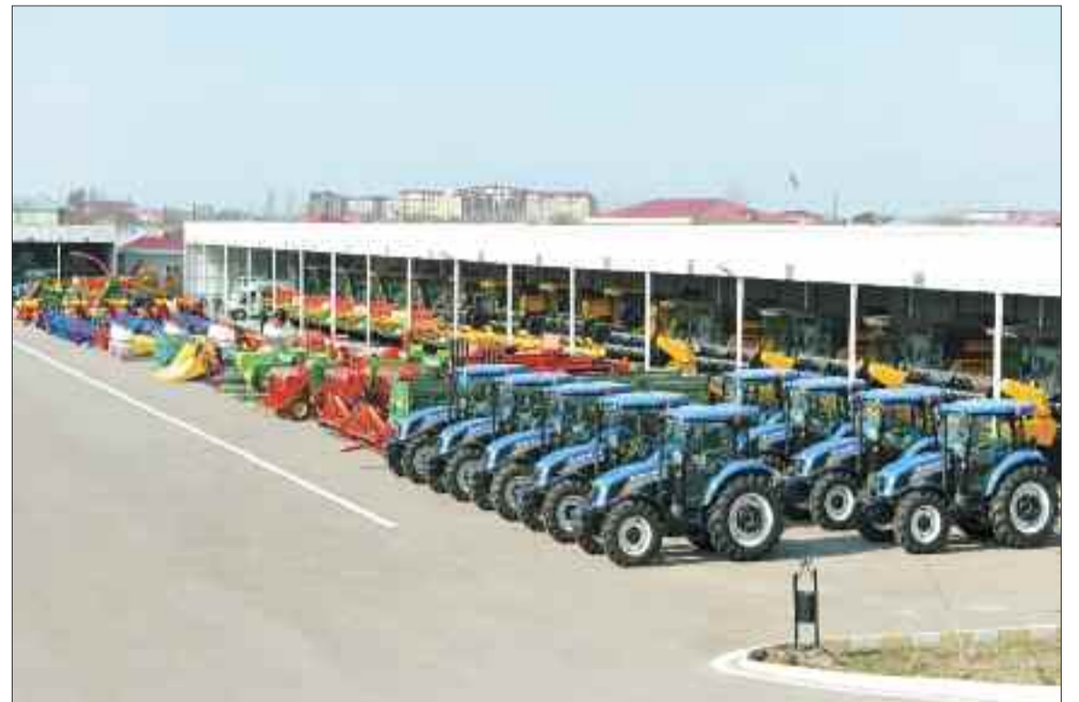
Naxçıvan Muxtar Respublikasına gətirilmiş yeni kənd təsərrüfatı texnikaları