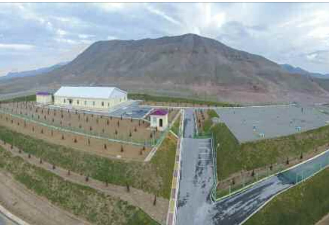
Culfa rayon mərkəzi və ətraf kəndlərin içməli su təchizatı sistemi