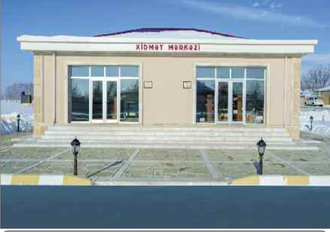
Şərur rayonunun Çəmənli kəndində xidmət mərkəzi