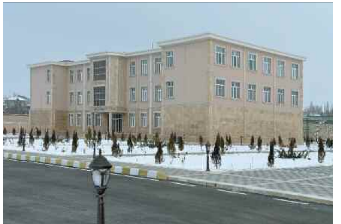
Naxçıvan şəhərinin Tumbul kəndində 376 şagird yerlik 13 nömrəli tam orta məktəb