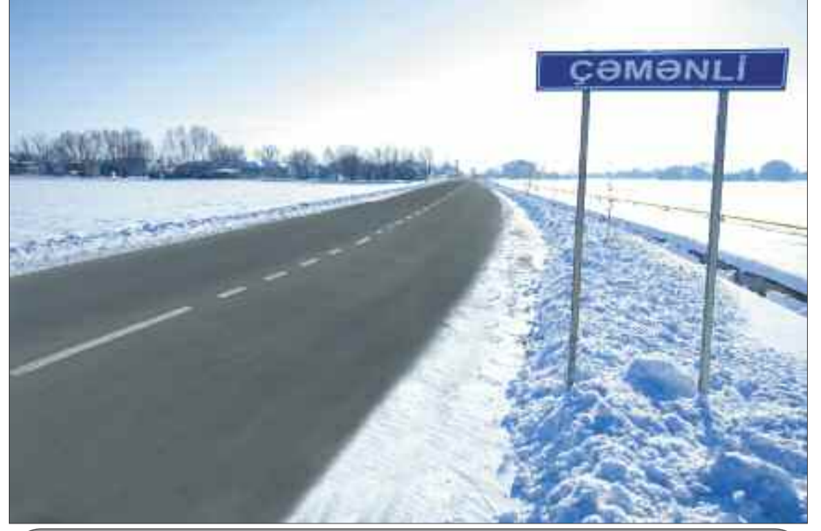
Şərur rayonunda Dərvişlər-Arpaçay-Çəmənli-Babəki kənd avtomobil yolu