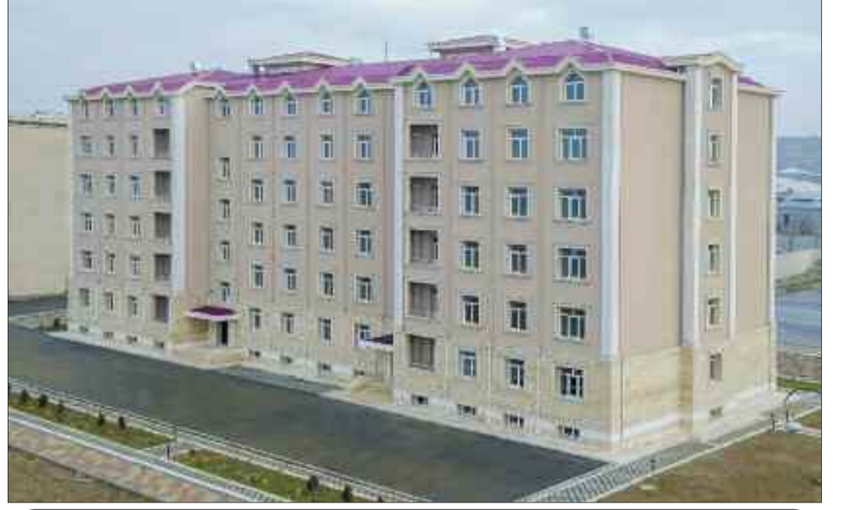
Naxçıvan Muxtar Respublikası Fövqəladə Hallar Nazirliyinin zabıt və gizirləri üçün yaşayış binası