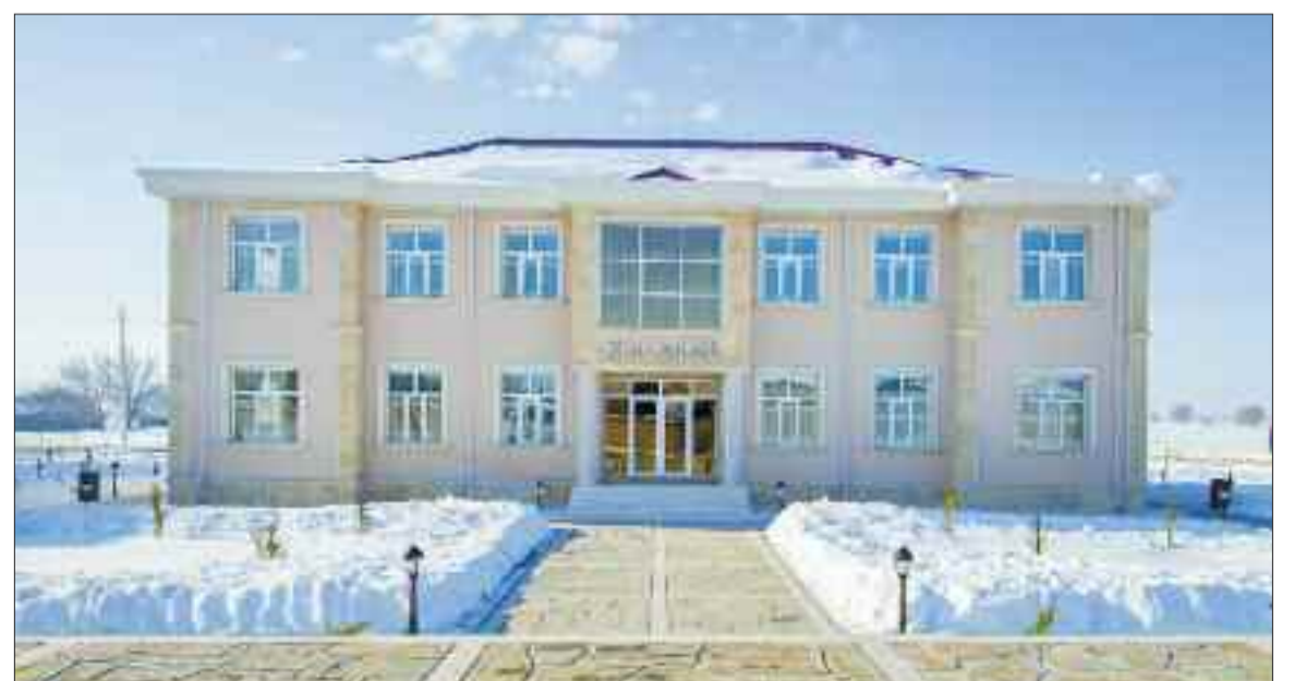
Şərur rayonu Çəmənli Kənd Mərkəzi