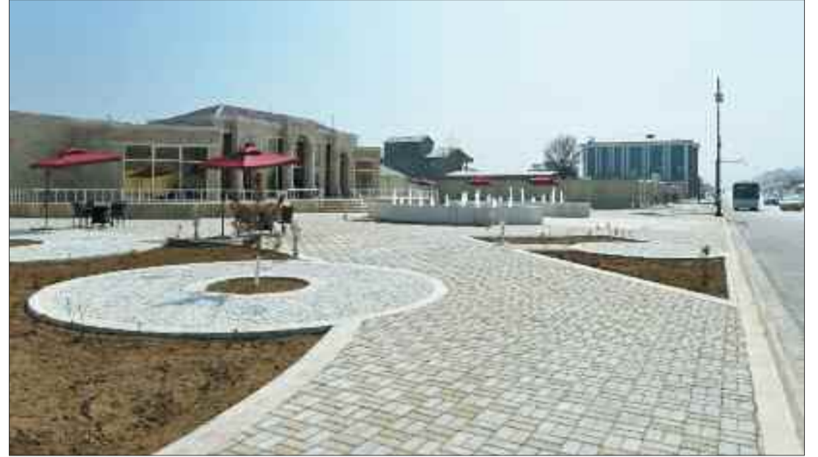
Naxçıvan şəhərinin Əziz Əliyev prospektində istirahət parkı və kafe