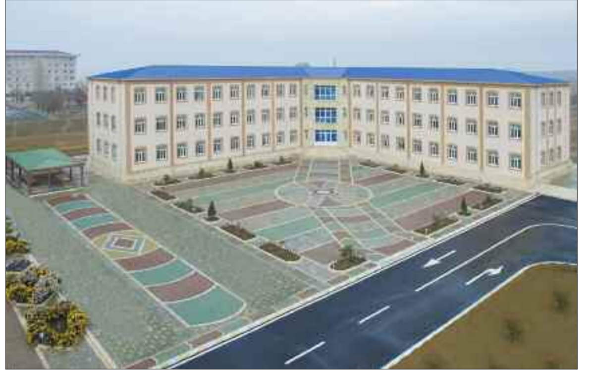
Əlahiddə Ümumqoşun Ordusunun "N" hərbi hissəsindəki əsgər yataqxanası