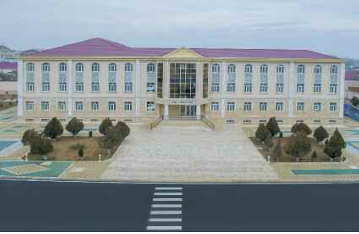
Naxçıvan şəhərində 640 şagird yerlik 3 nömrəli tam orta məktəb