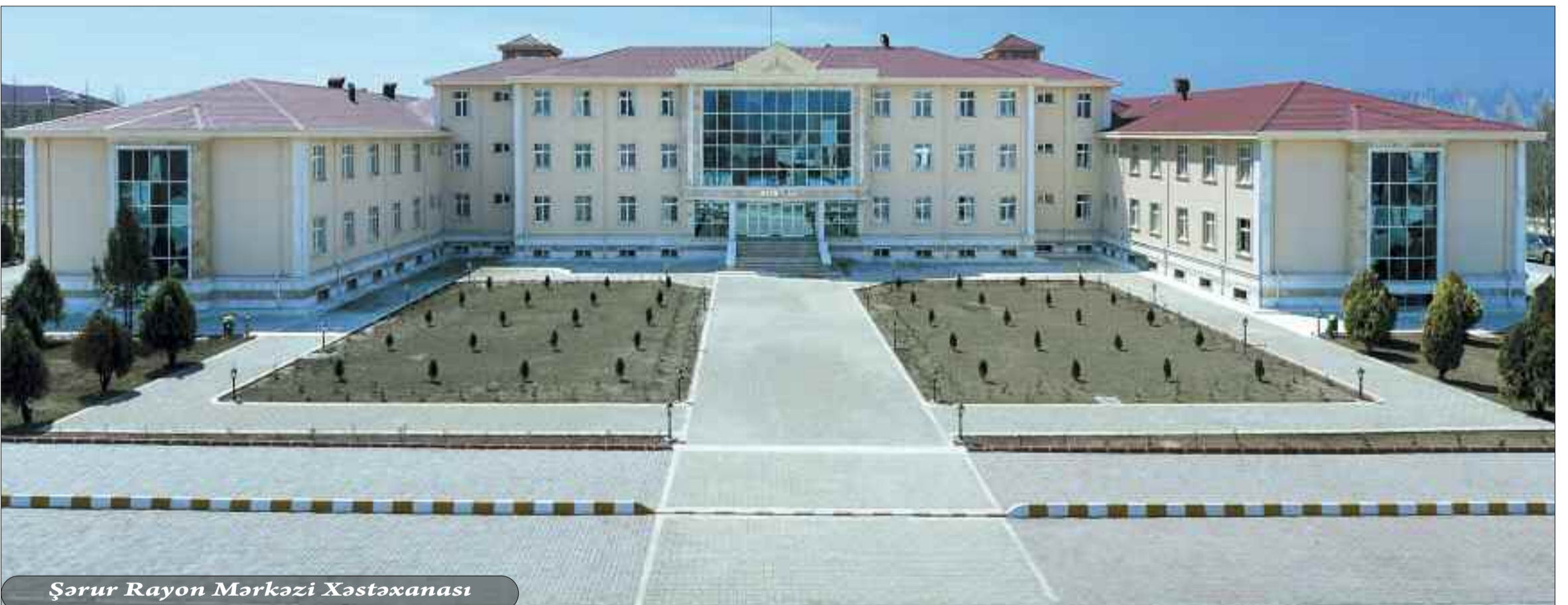
Şərur Rayon Mərkəzi Xəstəxanası