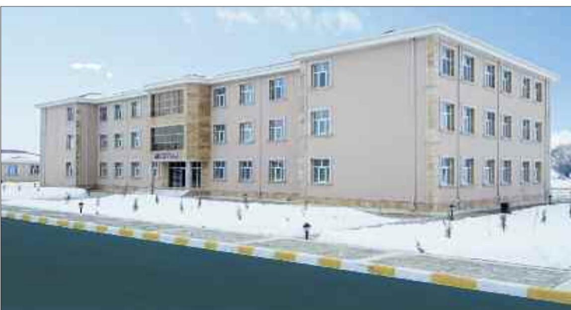
Şərur rayonunun Çəmənli kəndində 380 şagird yerlik tam orta məktəb