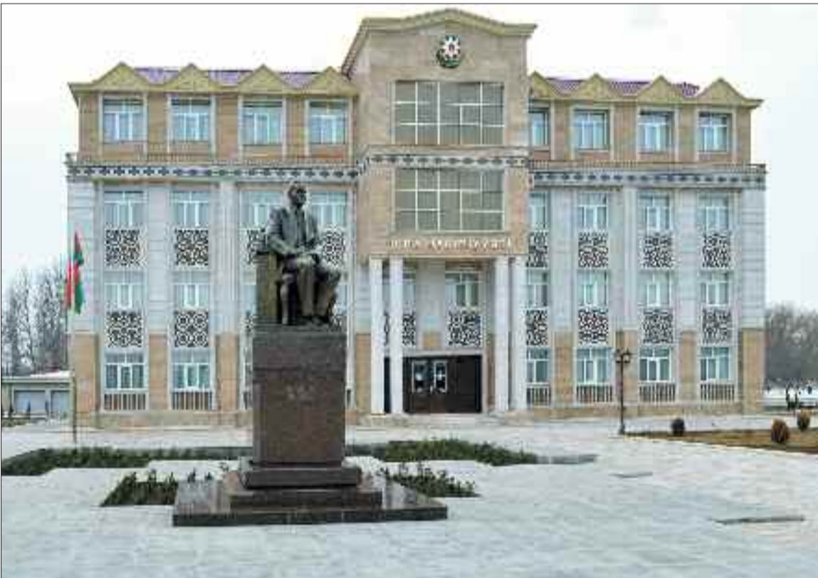
Babək Rayon İcra Hakimiyyətinin inzibati binası