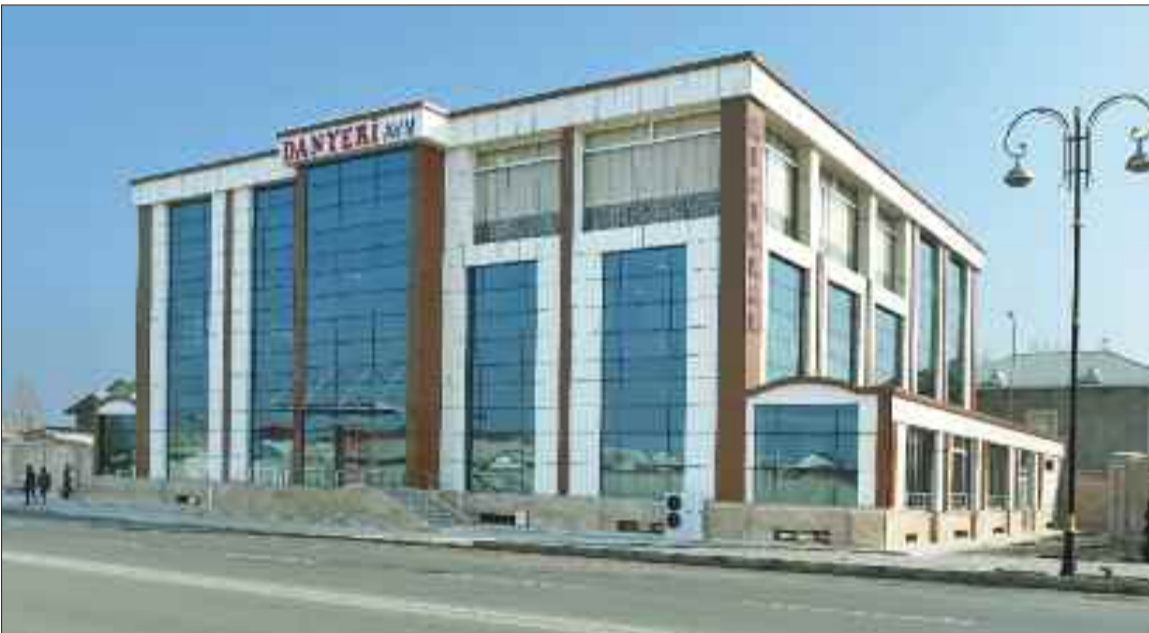
Naxçıvan şəhərinin Əziz Əliyev prospektində "Danyeri" istehsal və xidmət sahəsi