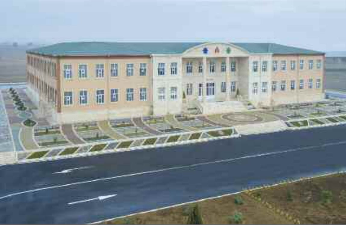
Əlahiddə Ümumqoşun Ordusunun "N" hərbi hissəsindəki Əsgəri-Məişət Kompleksi