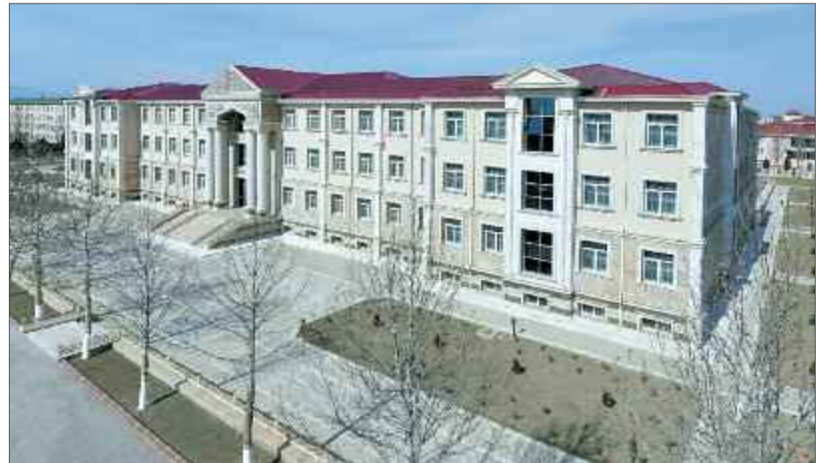
Şərur şəhərində 1020 şagird yerlik 2 nömrəli tam orta məktəb