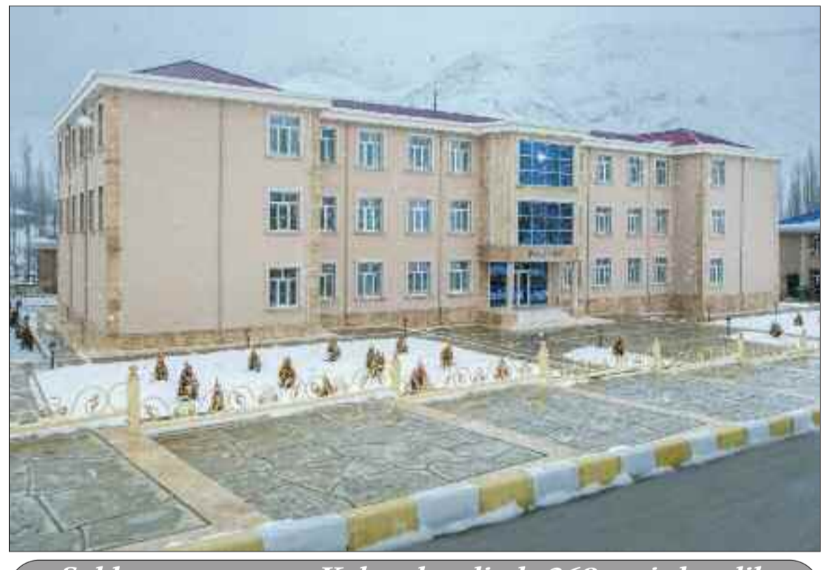
Şahbuz rayonunun Kolanı kəndində 360 şagird yerlik tam orta məktəb