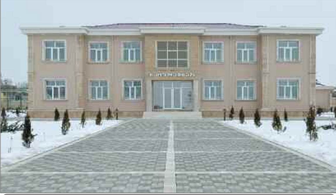
Naxçıvan şəhəri Tumbul Kənd Mərkəzi