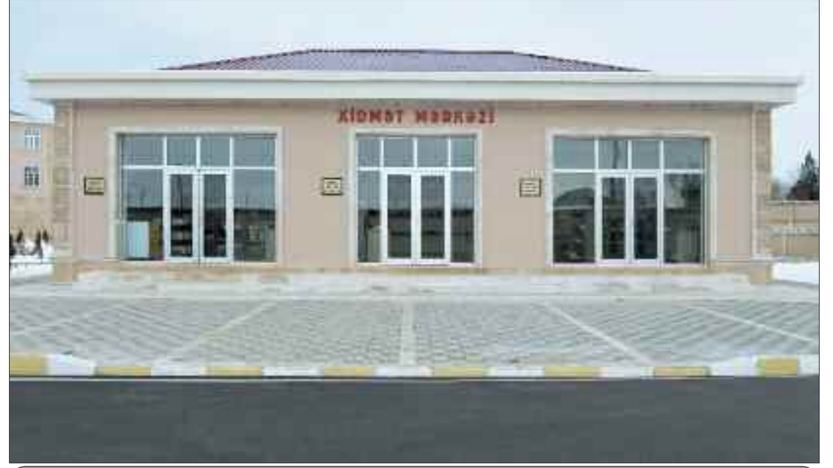
Naxçıvan şəhərinin Tumbul kəndində xidmət mərkəzi