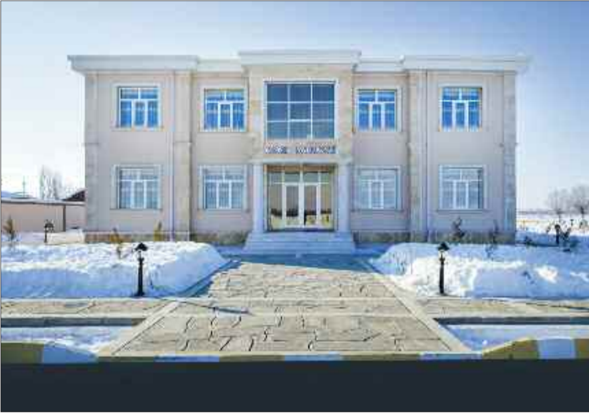
Şərur rayonu Arpaçay Kənd Mərkəzi