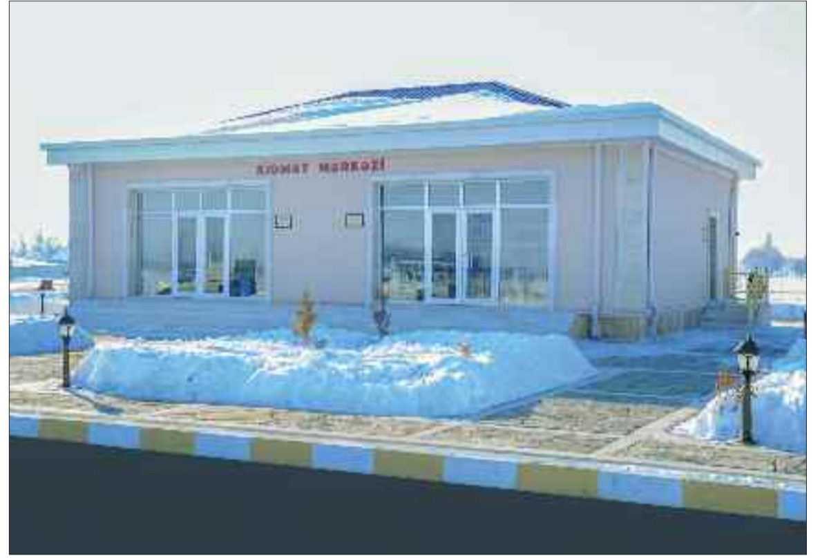
Şərur rayonunun Arpaçay kəndində xidmət mərkəzi