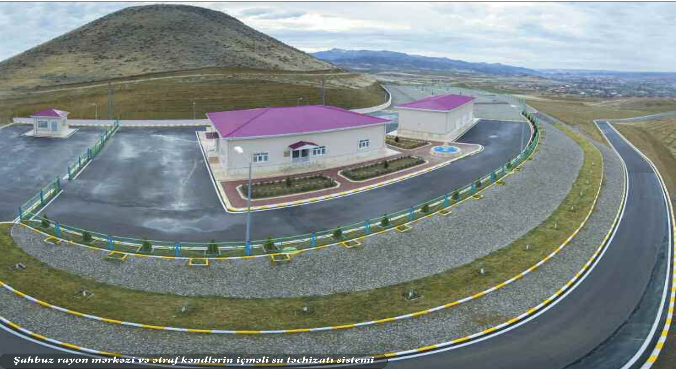
Şahbuz rayon mərkəzi və ətraf kəndlərin içməli su təchizatı sistemi