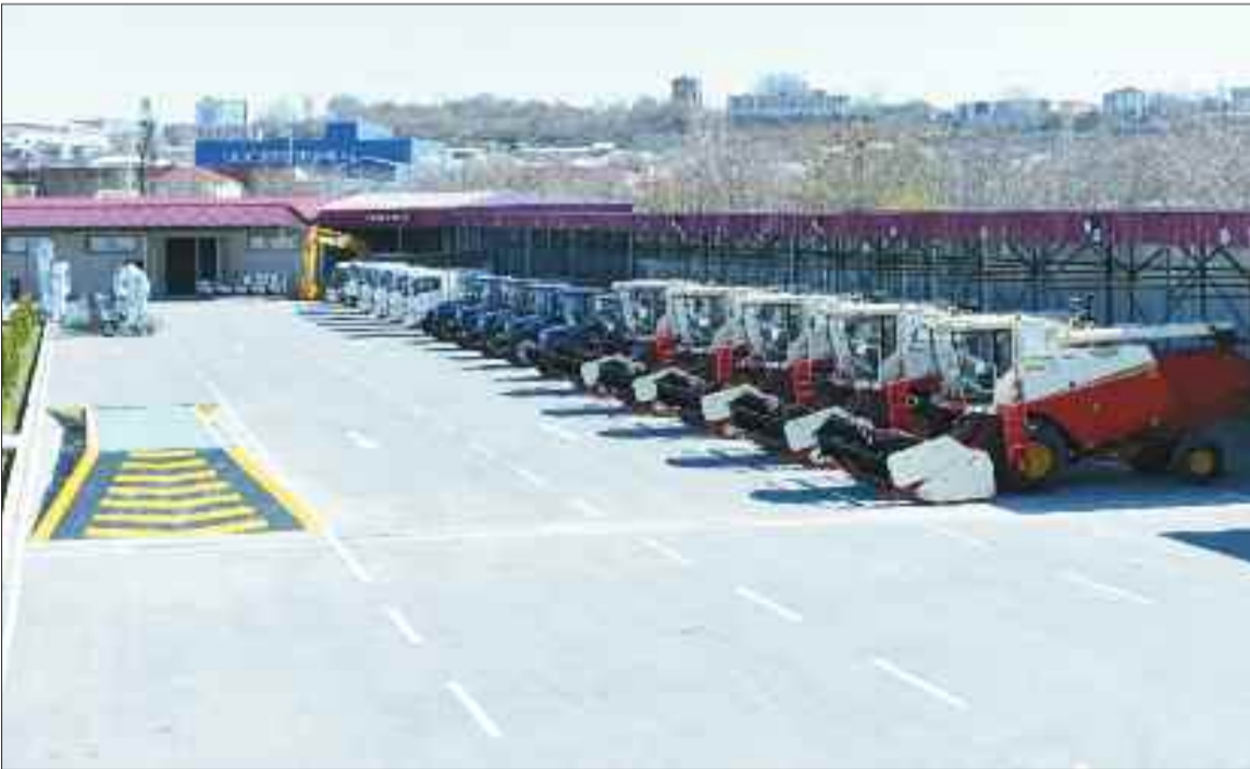
Naxçıvan Muxtar Respublikası "Bərəkət Buğda Məhsulları" Məhdud Məsuliyyətli Cəmiyyətinin toxumçuluq təsərrüfatına verilmiş yeni kənd təsərrüfatı texnikaları və toxumçuluq laboratoriyası avadanlıqları