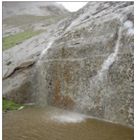
Əlinçəqalada su hovuzu

Hovuzların qazılma texnikası, demək olar ki, bənzərdir. Əvvəlcə hovuzlar üçün insanların gədə biləcəyi əlverişli mövqelər seçilmişdir. Hovuzlar qayanın çapılması ilə inşa