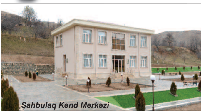
Şahbulaq Kənd Mərkəzi

kəndin icra nümayəndəsi Rafiq Məmmədov və müavini Şahbaz Cəfərov yoldaşlıq elədilər. Onlar ara vermədən kənd haqqında məlumat verirdilər və dediklərindən belə məlum olurdu ki, 60 evlik Şahbulağın 150 baş inəyi (yəni gözyarı hesablayanda hər qapıdan orta hesabla 2-3 baş inək çıxır), 400 başdan çox qoyun-quzusu, 350 arı ailəsi var. Toyuq-cücənin sayını bilmədiklər. Şahbulaqlılar istiqanlı, qonaqpərvər insanlardır, ürəyin istəyən qapını, darvazanı aç, səni gülərlə qarşılayacaqlar. "Qonaq Allah qonağıdır" deyəcəklər və onların inancına görə, qonağın ruzisini də Ulu Tanrı özü ilə birlikdə göndərir.