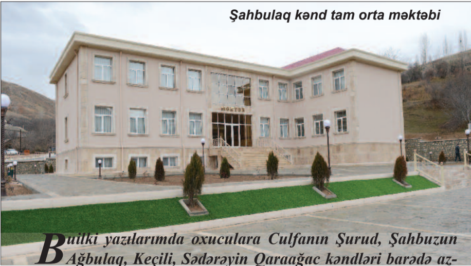
Şahbulaq kənd tam orta məktəbi

B ütlük yazılarımda oxuculara Culfanın Şurud, Şahbuzun Ağbulaq, Keçili, Sədarəyin Qaraağac kəndləri barədə az-çox məlumat vermişəm, ilin axırındakı səfərim Şərur rayonunun Şahbulaq kəndinə oldu və oxucuya bir məramımı da çatdırım ki, bu kəndlər ən ucqar və həm də aztanınan kəndlərdir.