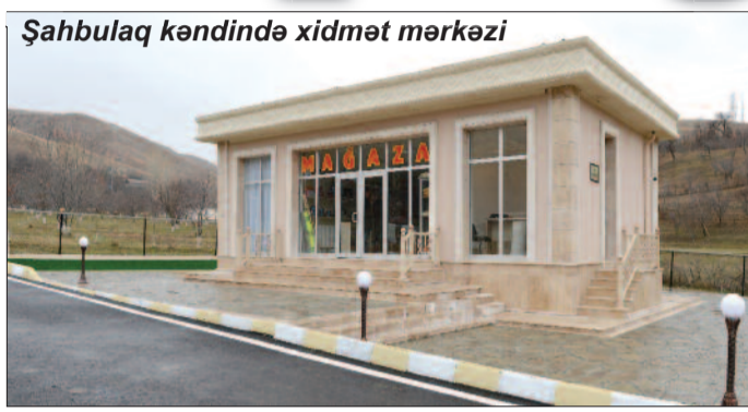
Şahbulaq kəndində xidmət mərkəzi

duğu kimi qeyd dəftərcəmə köçürməyə çalışıram.