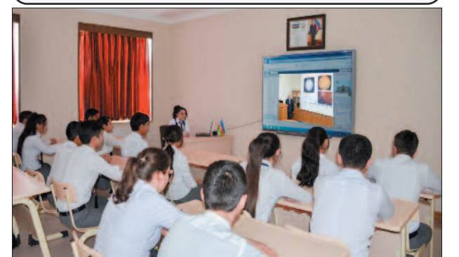
Babək rayon Qahab kənd tam orta məktəbi