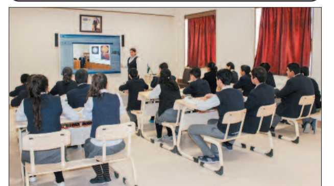
Ordubad şəhər 3 nömrəli tam orta məktəb