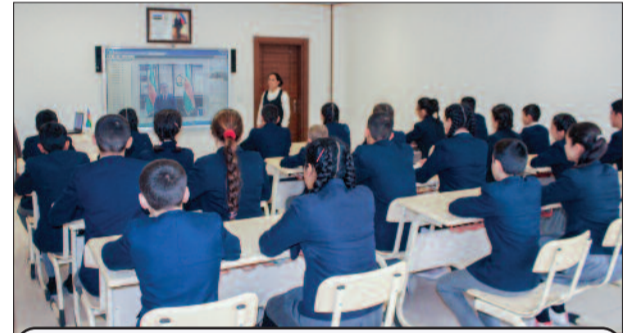
Ordubad şəhər 3 nömrəli tam orta məktəb

lib, beynəlxalq təcrübədə nümunəvi model kimi dövlət idarəetməsinin təşkilinin mükəmməl hüquqi bazasını yaradıb.