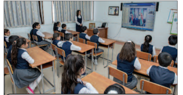
Naxçıvan şəhər 1 nömrəli tam orta məktəb

Vurğulanıb ki, Naxçıvan Muxtar Respublikası Konstitusiyasının qəbul edilməsi Naxçıvan Muxtar Respublikasının statusunu, muxtariyyətinin əsaslarını, dövlət hakimiyyətinin hakimiyyətlərin bölünməsi prinsipi əsasında təşkilini, onların qarşılıqlı əlaqəsini müəyyənləşdirib. Həmin Konstitusiyaya ilə Naxçıvan Muxtar Respublikasında ilk dəfə Ali vəzifəli şəxs institutu təsis edilib. Bu Konstitusiyanın qəbulu siyasi-hüquqi əhəmiyyətinə görə nəinki muxtar respublikada, bütövlükdə, ölkəmizdə mühüm əlamətdar hadisəyə çevri-