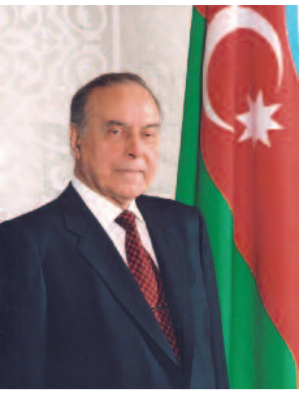
Doğma, canım-varlığım qədar sevdiyim Azərbaycanım mənim qibləgahumdur