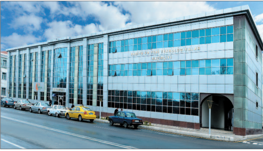
Naxçıvan Muxtar Respublikası Ali Məclisi Sədrinin 2004-cü il 28 fevral tarixli Fərmanı ilə Naxçıvan Muxtar Respublikasının Rabitə və İnformasiya Texnologiyaları Nazirliyi yaradılmışdır. Ali Məclis Sədrinin 2014-cü il 19 sentyabr tarixli Fərmanına əsasən isə Rabitə və İnformasiya Texnologiyaları Nazirliyi Rabitə və Yeni Texnologiyalar Nazirliyi adlandırılmış, nazirliyin səlahiyyətləri daha da genişləndirilmişdir.

Rabitə və yeni texnologiyaların tətbiqi məqsədilə reallaşdırılmış məqsədyönlü tədbirlər muxtar respublikanın hazırkı sosial-iqtisadi inkişafında bu sahənin rolunu daha da artırmışdır. Son illər muxtar respublikada əhaliyə nümunəvi rabitə xidmətinin göstərilməsi məqsədilə konkret vəzifələr müəyyənləşdirilmiş, bu sahədə mühüm irəliləyişlər əldə olunmuşdur. Rabitə sektoruna investisiyaların cəlb edilməsi nəticəsində istismarda olan avtomat telefon stansiyaları müasir tələblərə cavab verən yeni rabitə sistemi ilə əvəz olunmuş, ən ucqar dağ kəndində belə, genişzolaqlı, yüksək-sürətli internet və digər müasir telekommunikasiya şəbəkələri istifadəyə verilmişdir. Muxtar respublikada yeni nəsil texnologiyaların tətbiqi ilə əlaqədar nəzərdə tutulan 4 mərhələdən ibarət layihə artıq başa çatdırılmışdır. Belə ki, 4-cü nəsil telekommunikasiya xidmətlərindən yararlanmağa imkan verən NGN avadanlıqları istifadəyə verilmiş, telekommunikasiya şəbəkəsi üzrə sabit telefon nömrələri 7 rəqəmli nömrə planına keçirilmişdir. Hazırda istifadə olunan avtomat telefon stansiyalarının 86 faizini yeni nəsil texnologiyalar təşkil edir.