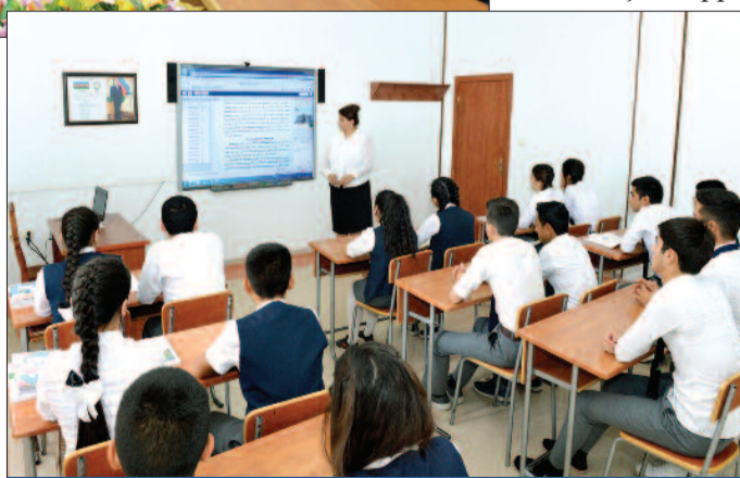
Naxçıvan şəhər 1 nömrəli tam orta məktəb

Diqqətə çatdırılıb ki, bu gün Naxçıvan Muxtar Respublikasında da dövlət dil siyasəti uğurla həyata keçirilir. Naxçıvan şəhərində “Ana dili”