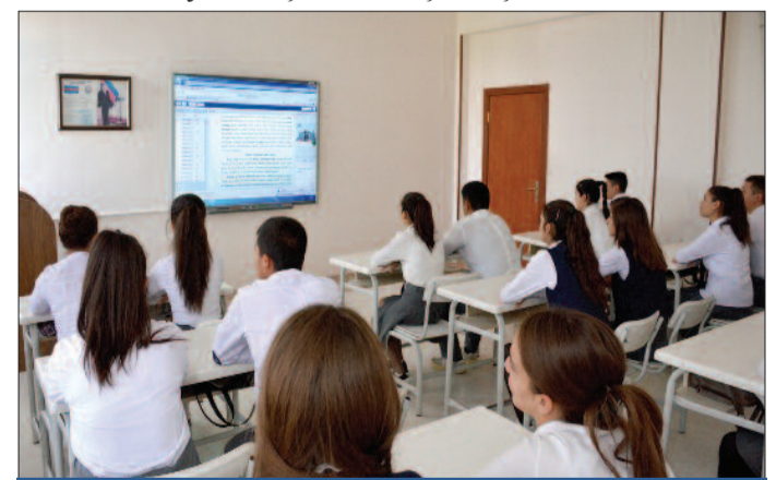
Babək qəsəbə 1 nömrəli tam orta məktəb

əhəmiyyət kəsb edən bu sənəd dilimizin inkişafı və tətbiqi sahəsində meydana çıxan problemlərin həllində mühüm rol oynayıb. Həmin fərmanda Azərbaycan Prezidenti yanında Dövlət Dil Komissiyasının yaradılması da nəzərdə tutulurdu. Belə bir qurumun yaradılması ana dilimizin tətbiqi işinin təkmilləşdirilməsinə daha səmərəli şəkildə nəzarət etmək və bu prosesi ümummilli maraqlar kontekstində tənzimləmək məqsədi daşıyırdı. 2001-ci il avqustun 9-da isə ulu öndər yeni fər-