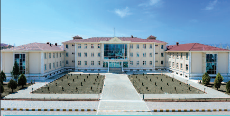
Müasir səhiyyə ocaqlarımız