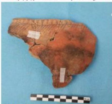
Şəkil 3. Orta Eneolit dövrünün boyalı keramikası (Uçan Ağıl).

yəti üçün xarakterik olan bir-biri üzərində yerləşdirilən üçbucaqlarla bəzəmə və həndəsi motivdə naxışlanmış keramika diqqətçəkicidir. Keramika nümunələrinin bəziləri relyef kəmərlər üzərindən barmaq basqısı ilə naxışlanmışdır. Bu tip keramika nümunələri Culfa Kültəpəsinin VII təbəqəsindəndir [11, s. 113, fig.12, 9-10; s. 116, fig. 15, 5]. Keramika nümunələrinin araşdırılması onların e.ə. V minilliyin birinci yarısına və OvçularTəpəsindən [10, s. 108-121] və Sirab abidələrindən [8, s. 88-95; 9, s. 136-145] əvvələ aid olduğunu təsdiq edir. Bu, abidədən götürülən karbon nümunələrinin analizi ilə də təsdiq olunmuşdur. Karbon analizlər e.ə. V minilliyin birinci yarısını göstərmişdir (e.ə. 4690-4450). Uçan Ağıl, Uzunoba və Bülövkəyə yaşayış yerlərindən Culfa Kültəpəsindən məlum olan Dalmatəpə tipli boyalı keramika parçalarının aşkar olunması bu yaşayış yerləri arasında əlaqələrin olduğunu təsdiq edir.