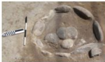
Şəkil 1. Daş çevrəli ocaqların I tipi.

Birinci qrupa aid olanlar 947.34; 947.26 sm dərinlik səviyyəsində qeydə alınmış daş çevrəli ocaqlardır. Onların dairəvi (diametr = 30×40sm), aypara (d = 35×50) və oval (d = 45×75; 60×110) formalarına rast gəlinmişdir (KT-16, E-251; E-253; E-196). Onlar özü də üç tiplə təmsil olunmuşdur. Birinci tipə aid olanlar tamamilə daşla çevrələnmiş və bir qisminin içərisinə yarıyadək yastı çay daşları döşənmişdir. 2015-ci ildə I Kültəponin E kvadratında qeydə alınan aypara şəkilli ocaq 35×50 sm ölçüsündə olub, yastı çay daşları ilə çevrələnmişdir (şəkil 1).