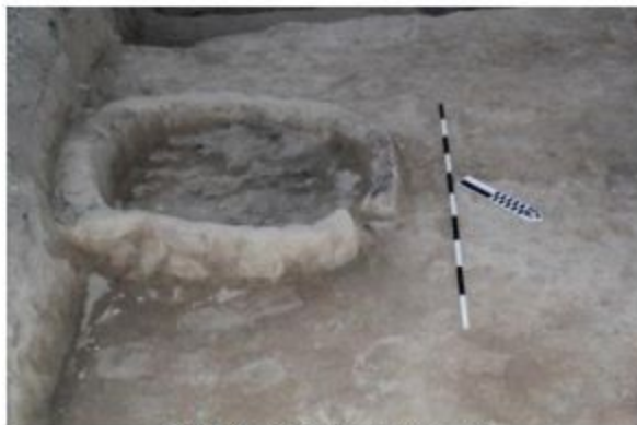
Şəkil 6. Kərpic divarlı ocaq (III qrup).

kin Kültürünün neolit təbəqəsindən aşkar olunan bu tipli ocaqlarda kərpiclərin interyer hissəsi istisna olmaqla, digər tərəflərində qalın, yanma izləri yoxdur. Bu da onların çiy kərpicdən tikildiyini göstərir.