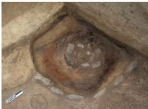
Şəkil 2. Daş çevrəli ocaqların II tipi.

Daş çevrəli ocaqların ikinci tipinə aid olanların (KT-16, J-062; J-088) bir hissəsi çay daşları, bir hissəsi isə qalın möhrə ilə əhatə olunmuşdur (dərinlik 944.804). Onlardan biri yuvarlaq dörd-künc formalı olub, ortasına az miqdarda nahamar daş döşənmişdir. F kvadratının cənubunda yerləşən bu ocağın mərkəzindəki daşların ətrafı dairəvi formada qızarmış torpaqla əhatə olunmuşdur (şəkil 2).