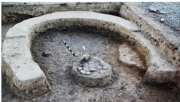
Şəkil 3. Daş döşəmədən ibarət ocaq.

Daş çevrəli ocaqların üçüncü tipi dairəvi formada olan kül qarışıqlı daş döşəmədən ibarətdir [4, s. 49]. E sahəsində aşkar edilən belə ocaqlardan biri nəşəkilli tikilinin mərkəzində qeydə alınmışdır. Bu əlamət onun sətəyiş məqsədli olması ehtimalına əsas verir. Onun bir tərəfində iri həcmli dən daşının bir hissəsi şaquli şəkildə yerləşdirilmiş, ondan cənuba doğru dairəvi şəkildə genişlənən kül qatı üzərində düzülən nisbətən kiçik ölçülü yastı daşlar və onların parçaları ilə birlikdə dairəvi döşəmə yaradılmışdır (şəkil 3).