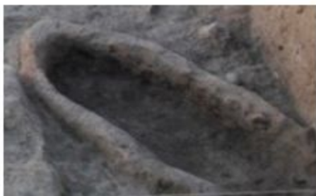
Şəkil 5. İri ölçülü gil badlı ocaq (II qrup).

Gil badlı ocaqların ikinci tipi iri həcmli olmaları ilə fərqlənir. 947.31 m. dərinlikdə üzə çıxarılan belə ocaqların diametrləri 42×90, 60×84 sm arasında dəyişir. 2016-cı ildə J kvadratındakı oval evin cənub divarının xaricində aşkar edilmiş uzunsov oval formalı ocağın tünd qəhvəyi rəngli gil-dən olan divarının eni 5-7, içəri hissəsinin isə uzunluğu 1 m, eni 45 sm arasında olub, içərisindən sümük qalıqları və xeyli miqdarda kül üzə çıxarılmışdır (şəkil 5).