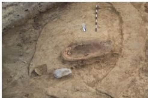
Şəkil 4. Kiçik ölçülü gil badlı ocaq (II qrup).

Gil badlı ocaqların ikinci tipi iri həcmli olmaları ilə fərqlənir. 947.31 m. dərinlikdə üzə çıxarılan belə ocaqların diametrləri 42×90, 60×84 sm arasında dəyişir. 2016-cı ildə J kvadratındakı oval evin cənub divarının xaricində aşkar edilmiş uzunsov oval formalı ocağın tünd qəhvəyi rəngli gil-dən olan divarının eni 5-7, içəri hissəsinin isə uzunluğu 1 m, eni 45 sm arasında olub, içərisindən sümük qalıqları və xeyli miqdarda kül üzə çıxarılmışdır (şəkil 5).