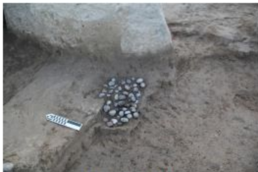
Şəkil 7. Ocaqların IV qrupu.

Dördüncü qrupa aid ocaqlar digərlərindən fərqli olaraq əsasən divarların dibində yerləşmişdir. Düşmədə qazılan belə ocaqlar dairəvi formalıdır, içərisində küllə qarışmış halda olan kiçik ölçülü yuvarlaq və yastı daşlar qeydə alınmışdır. 2014-cü ildə D sahəsində üzə çıxarılan bu tipli ocağın içərisində qırmızı, yaşıl, boz rənglərdə olan 220-dək belə daşların olduğu müəyyənləşdirilmişdir (KT-15, D-88). Belə ocaqlardan biri də 2015-ci ildə E sahəsindəki dairəvi evin şimal-şərq hissəsində qeydə alınmışdır. İstiliyi təmin etmək məqsədi daşıyan bu cür daşlarla doldurulmuş ocaqların diametri 40x45 sm-ə çatır (şəkil 7).